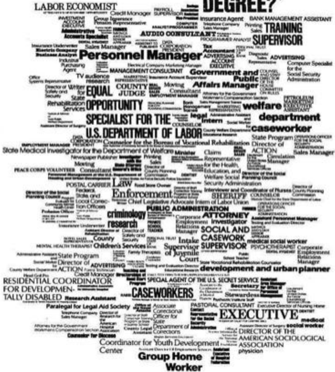
© Department of sociology, Eastern Illinois University, Charleston, Illinois, USA