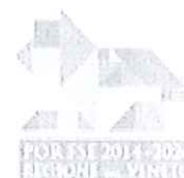
FORSE 2014-2020 REGIONE del VENETO